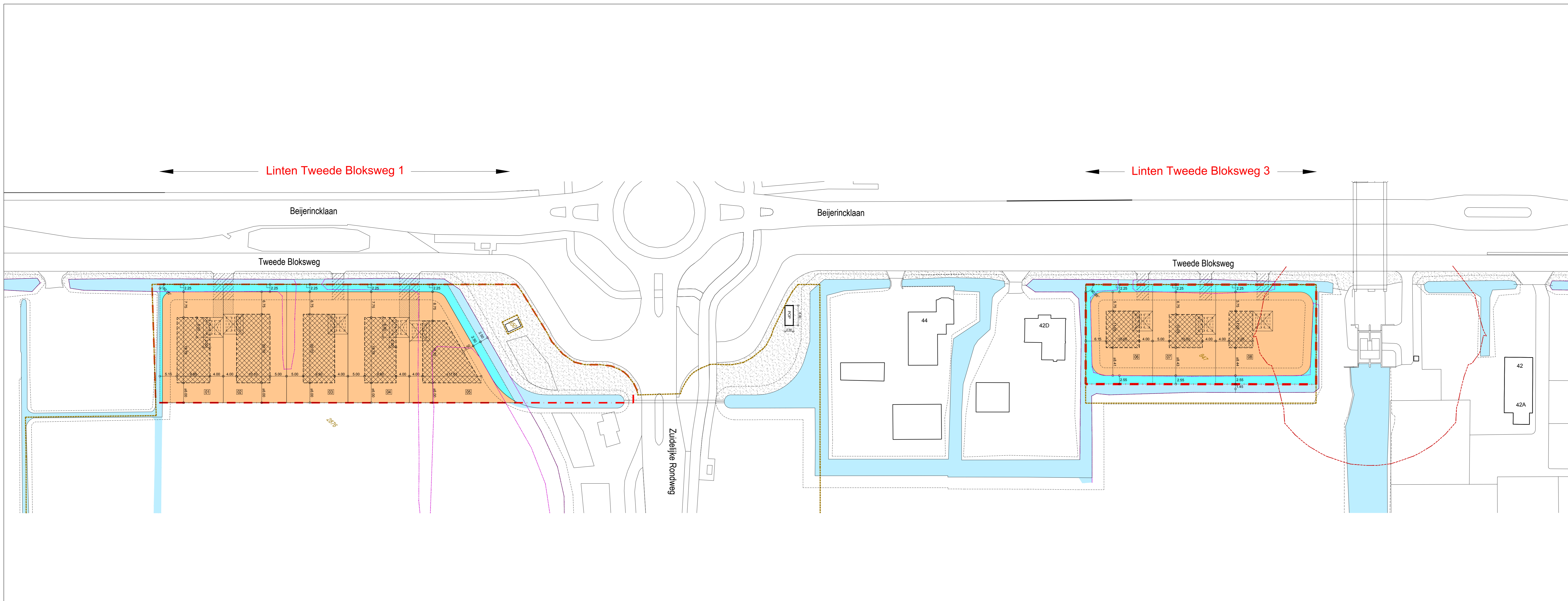
SMP LINTEN TWEEDE BLOKSWEG - BLAD 1